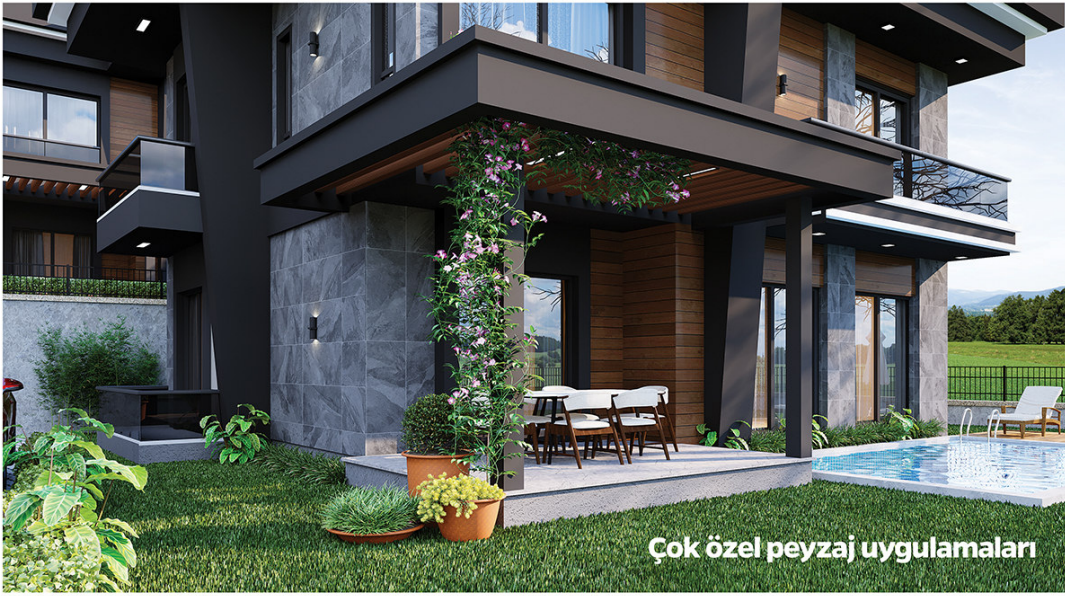
Çok özel peyzaj uygulamaları