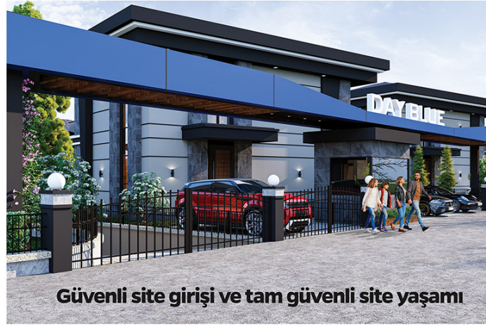
Güvenli site girişi ve tam güvenli site yaşamı